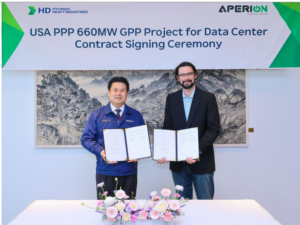
도표 1. HD현대중공업, 미국 데이터센터에 6,271억원 규모 발전설비 공급