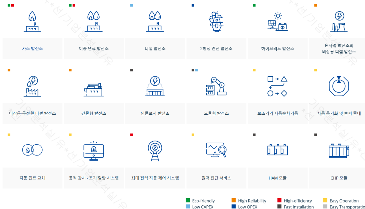
도표 2. HD현대중공업 엔진기계사업부 에너지 솔루션 및 서비스